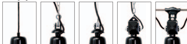
Kabel-Aufhängung K/... Alu-Gussaufhängung mit vernickelter Kette AGK/... Alu-Gussaufhängung mit Stahlseil AGS/... Alu-Kabel-Box mit vernickelter Kette ABK/... Alu-Kabel-Box mit Seilaufhänger ABS