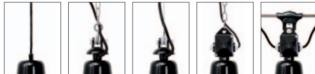
Kabel-Aufhängung K/... Alu-Gussaufhängung mit vernickelter Kette AGK/... Alu-Gussaufhängung mit Stahlseil AGS/... Alu-Kabel-Box mit vernickelter Kette ABK/... Alu-Kabel-Box mit Seilaufhänger ABS