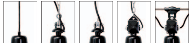
Kabel-Aufhängung K/... Alu-Gussaufhängung mit vernickelter Kette AGK/... Alu-Gussaufhängung mit Stahlseil AGS/... Alu-Kabel-Box mit vernickelter Kette ABK/... Alu-Kabel-Box mit Seilaufhänger ABS